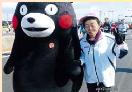
▲くまもと走りました

マラソンを始めて20年になります。ホノルルマラソンを目指したのがきっかけです。仕事と両立しての参加はなかなか大変ですが、月1回のペースで出ています。夏場は暑いので、また、涼しくなってから出場しようと思っています。今年最初に走った熊本城マラソンは、6時間で完走しました。