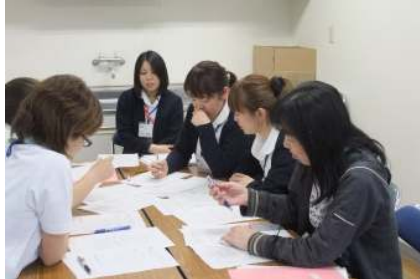
▲みんなで意見を出して話し合い

入職間もない不安がいっぱいの初々しい新人から、経験を積み、頼もしくなってくる2年目・3年目、10年以上のベテランも、各段階に応じて継続的な勉強会を開催しています。